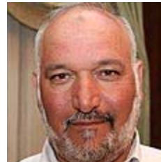
שיח טהא. לדבר עם הסבל