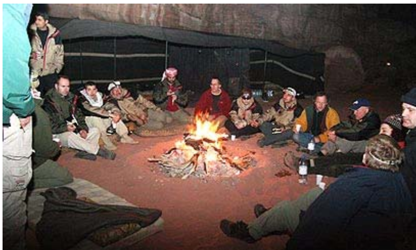
משתתפי המסע מתכוננים בירדן

המסע מתוכנן כך שכל אחד מהמשתתפים יהיה זקוק לסיוע של משתתפים אחרים, חלקם ממדינות אויב, ויחד יאלצו להתמודד מספר שבועות עם איתני הטבע. גם המשתתפים וגם המארגנים יודעים שיהיה קשה מאוד למנף אירוע תקשורת ליוזמת שלום של ממש, ומודים בחצי פה שהמטרה היא לייצר הד תקשורת, אך הם מקווים שהמסע יסייע ליצור אמון ואולי ישרה מעט אווירה של דו-שיח בין מדינות המערב למדינות מוסלמיות.